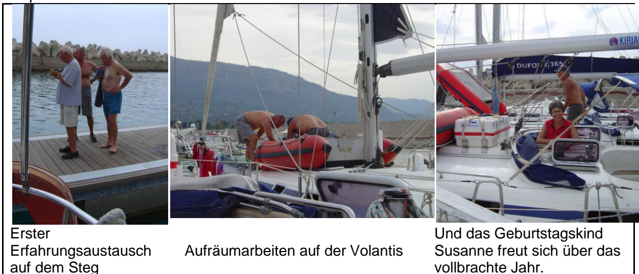
Erster Erfahrungsaustausch auf dem Steg

Der letzte Tag auf den Schiffen begann mit stürmischem Wind und Regen. Beides war aber wie am Vortag bald vorbei und die Sonne bescherte einen schwülheissen Tag. Am Morgen wurde die Schiffsübergabe vollzogen. Die Mannschaft der „Volantis VII“ verbrachte den Nachmittag in Cefalù, während die „Albatrosler“ das träge Decksleben vorzogen und die Mitarbeiter der Charterstation dabei beobachteten, wie diese sehr effizient die Wartungs- und Reparaturarbeiten an den Schiffen vornahmen.