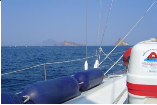
Noch einige Felsspitzen und der Stromboli ist da