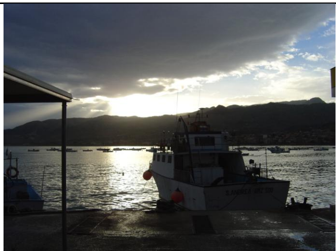
S'Agata am Morgen nach dem Gewitter

Am Tag der Abreise zeigte uns Petrus – wohl als Antwort auf unsere Klagen über zu wenig Wind – was bei korrekter Bestellung noch für uns reserviert gewesen wäre: Kurz nach fünf Uhr morgens weckte uns ein Sturm, der die am Steg im geschützten Hafen liegenden Schiffe um ca. 15 Grad krängte. Nach ca. 15 Minuten war der Spuck vorbei – ebenso wie unser Schlaf.