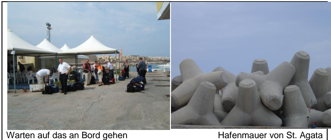
Warten auf das an Bord gehen