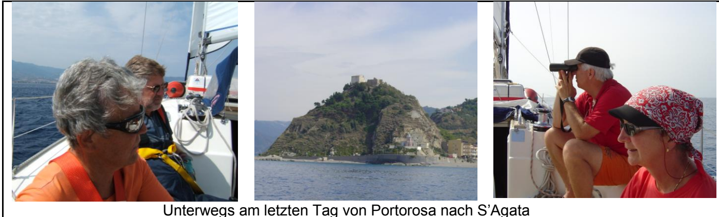
Unterwegs am letzten Tag von Portorosa nach S'Agata